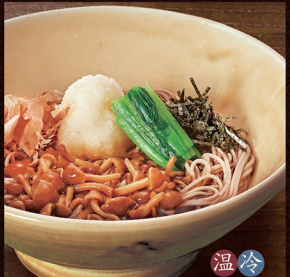
温冷 E-58 なめこおろそば 1,110円 E-59 なめこおろうどん 1,110円