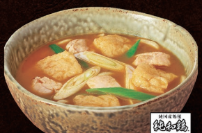
E-50 カレーうどん 1,140円