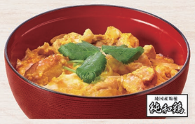
E-26 純和鶏丼 1,170円