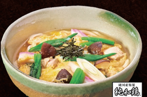
E-51 五目うどん 1,100円