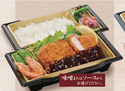
E-5 とんかつ弁当 1,390円 E-6 おかずのみ 1,150円