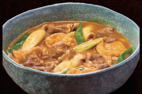
E-125 牛カレーうどん 1,270円