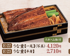
たれ・山椒付 E-22 うな重【一尾】(写真) 4,120円 E-23 うな重【半身】 2,710円