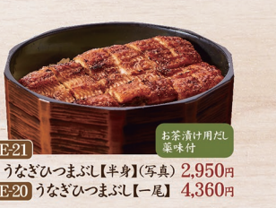
お茶漬け用だし 風味付 E-21 うなぎひつまぶし【半身】(写真) 2,950円 E-20 うなぎひつまぶし【一尾】 4,360円