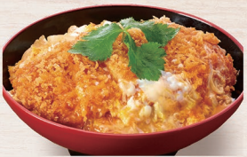
E-25 かつ丼 1,270円