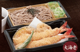
大海老 E-66 上天ざるそば 1,930円 E-67 上天ざるうどん 1,930円

E-72 かけそば 790円 温冷 E-73 かけうどん 790円 温冷 E-74 ざるそば 850円 E-75 ざるうどん 850円