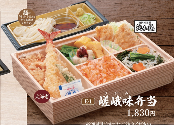
E-1 蝦夷味弁当 1,830円