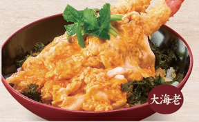
大海老 E-32 大海老天のふわたま丼 1,720円