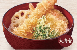
大海老 E-27 大海老天丼 1,300円