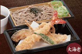
大海老 E-64 大海老天ざるそば 1,580円 E-65 大海老天ざるうどん 1,580円