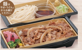
E-4 牛すき重麺セット 1,450円