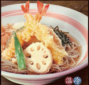
温冷 E-62 天おろそば 1,220円 E-63 天おろうどん 1,220円

E-72 かけそば 790円 温冷 E-73 かけうどん 790円 温冷 E-74 ざるそば 850円 E-75 ざるうどん 850円