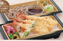
E-2 にざわい天重麺セット 1,330円