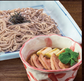
E-70 鴨汁ざるそば 1,480円 E-71 鴨汁ざるうどん 1,480円