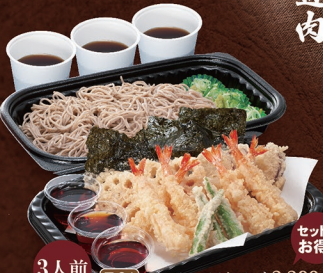
3人前 セット お得意! E-84 ファミリー天ざるそば 3,390円 E-85 ファミリーざるそば 2,360円 E-86 ファミリー天ぷら 1,570円