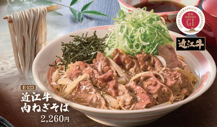
E-123 近江牛 肉ねぎそば 2,260円

サガミ自慢の 国産そば ※そばのつなぎは、 米国オーガストリアー産等の 小麦を使用しておりませぬ。