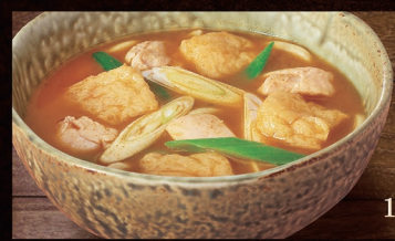
E-50 鶏カレー うどん 1,070円