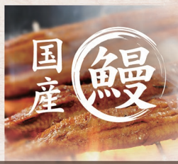
E-22 うなぎ丼【並】(写真) 3,070円 E-23 うなぎ丼【上】 4,710円