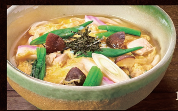
E-51 五目 うどん 1,070円