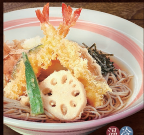
E-62 天おろそば 1,220円 E-63 天おろうどん 1,220円

E-72 かけそば 790円 温冷 E-73 かけうどん 790円 温冷 E-74 ざるそば 850円 E-75 ざるうどん 850円