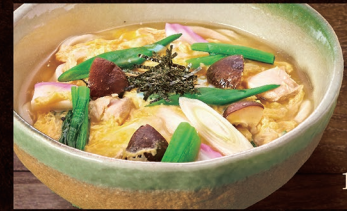
E-51 五目うどん 1,070円