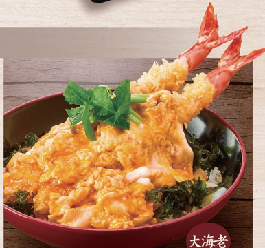
P-32 大海老天のふわたま丼 名物 1,720円