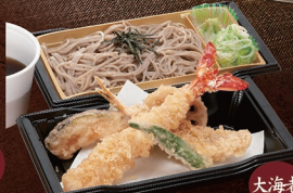
E-64 大海老天ざるそば 1,580円 E-65 大海老天ざるうどん 1,580円