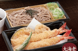
E-66 上天ざるそば 1,930円 E-67 上天ざるうどん 1,930円

E-72 かけそば 790円 温冷 E-73 かけうどん 790円 温冷 E-74 ざるそば 850円 E-75 ざるうどん 850円