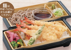
E-2 にぎわい天重麺セット 1,330円