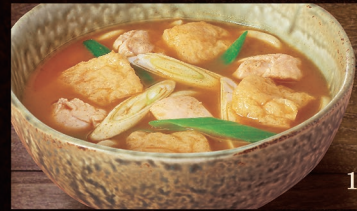
E-50 鶏カレーうどん 1,070円