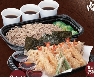
3人前 セットでお得! E-84 ファミリー天ざるそば 3,390円 E-85 ファミリーざるそば 2,360円 E-86 ファミリー天ぷら 1,570円