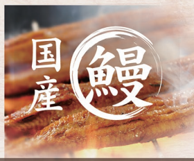
E-22 うなぎ丼【並】(写真) 3,070円 E-23 うなぎ丼【上】 4,710円