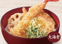
E-27 大海老天丼 1,300円