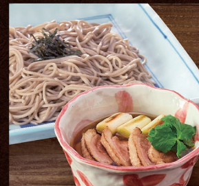
E-70 鴨汁ざるそば 1,480円 E-71 鴨汁ざるうどん 1,480円