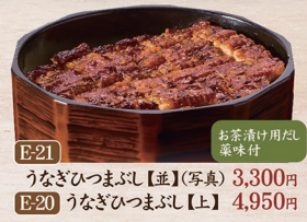
E-21 うなぎひつまぶし【並】(写真) 3,300円 E-20 うなぎひつまぶし【上】 4,950円