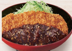
E-26 味噌かつ丼 1,270円