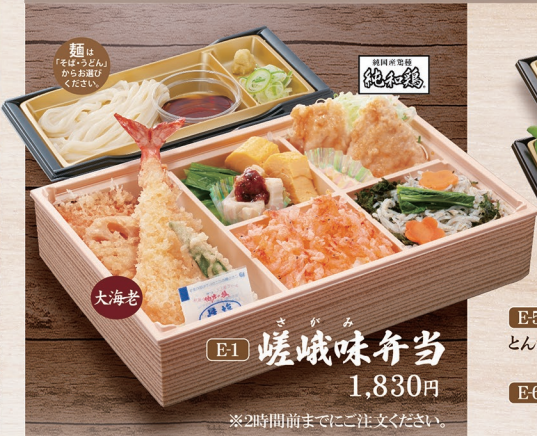
E1 さがみ 嵯峨味弁当 1,830円