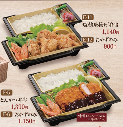
E-11 塩麹唐揚げ弁当 1,140円 E-12 おかずのみ 900円