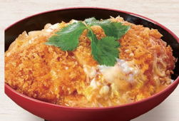
E-25 かつ丼 1,270円