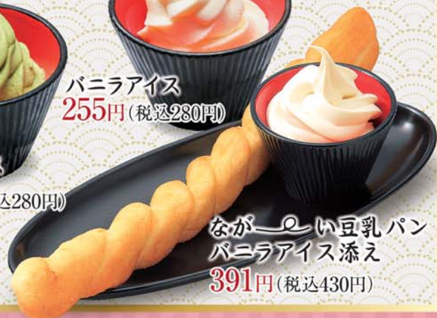
ながーい豆乳パン バニラアイス添え 391円(税込430円)