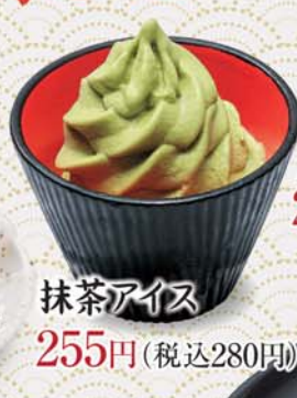
抹茶アイス 255円(税込280円)