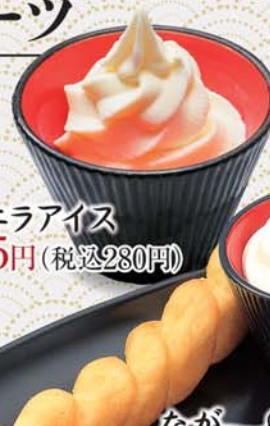
バニラアイス 255円(税込280円)