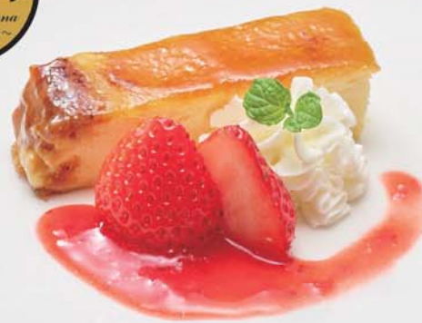
十勝カタラーナの苺添え