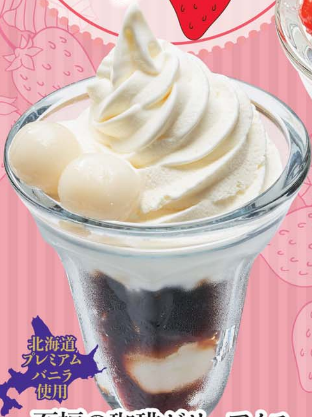
至福の珈琲ゼリーアイス