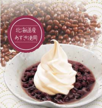
クリームぜんざい 455円(税込500円)