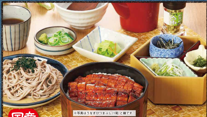
※写真はうなぎひつまぶし(1尾)と蕎麦です。