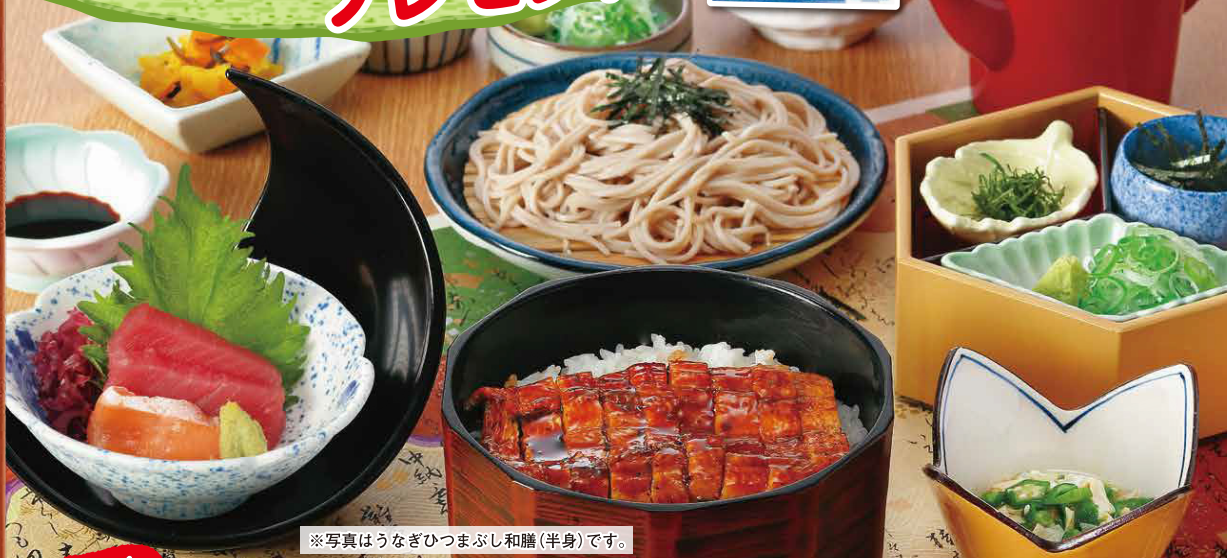
※写真はうなぎひつまぶし和膳(半身)です。