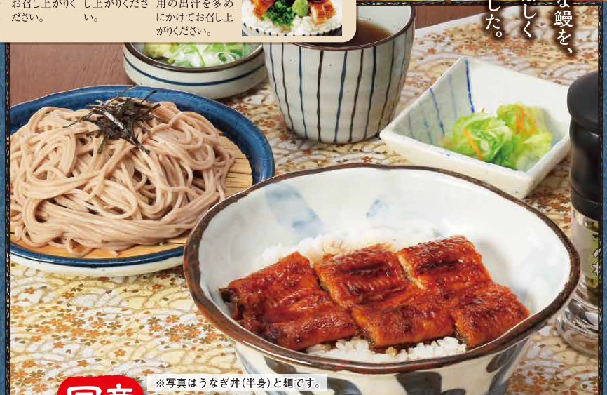
※写真はうなぎ丼(半身)と蕎麦です。