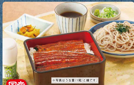
※写真はうなぎ重(1尾)と蕎麦です。