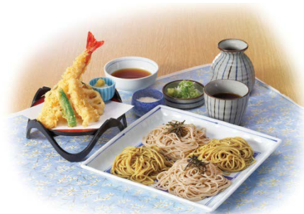
『満天きらりの韃靼そばと石挽そば』