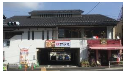
3月17日にグランドオープンした 和食麺処サガミいずみ中央店